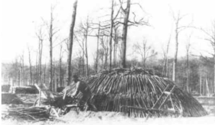
Construction de la fâde de bois dans la forêt. Photographie d'après [?]

An plin mitan et à grands côps d' masse, lu mwêsse-tchèrbouni aforce adon 3 pikèts, yinke dulé l'ôte à triangué pou fwêre coume ène tchuminée. C'est par là k'on mètrè lu feu l'fâde, avu du bwès ki prind l' pus vite.